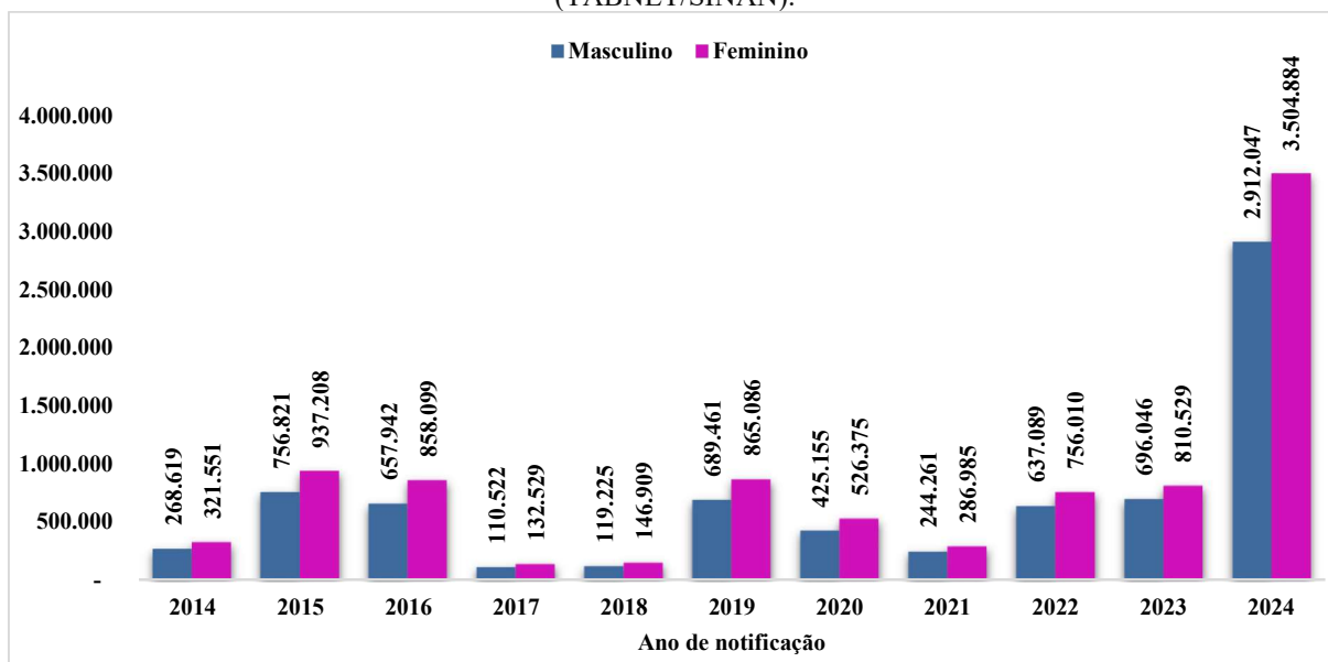
Gráfico 3 - Casos prováveis de dengue no Brasil por sexo segundo ano notificação 2014 a 2024 (TABNET/SINAN).

No período analisado, observou-se predomínio de casos de dengue no sexo feminino, como demonstrado no Gráfico 3 que respondeu por 54,8% das notificações (9.146.165), enquanto o sexo masculino representou 45,0 % (7.517.188). Essa diferença foi consistente em toda a série histórica e mais acentuada nos grandes surtos de 2015 e 2024, quando o Brasil registrou, respectivamente, 1,7 milhão e 6,4 milhões de casos.