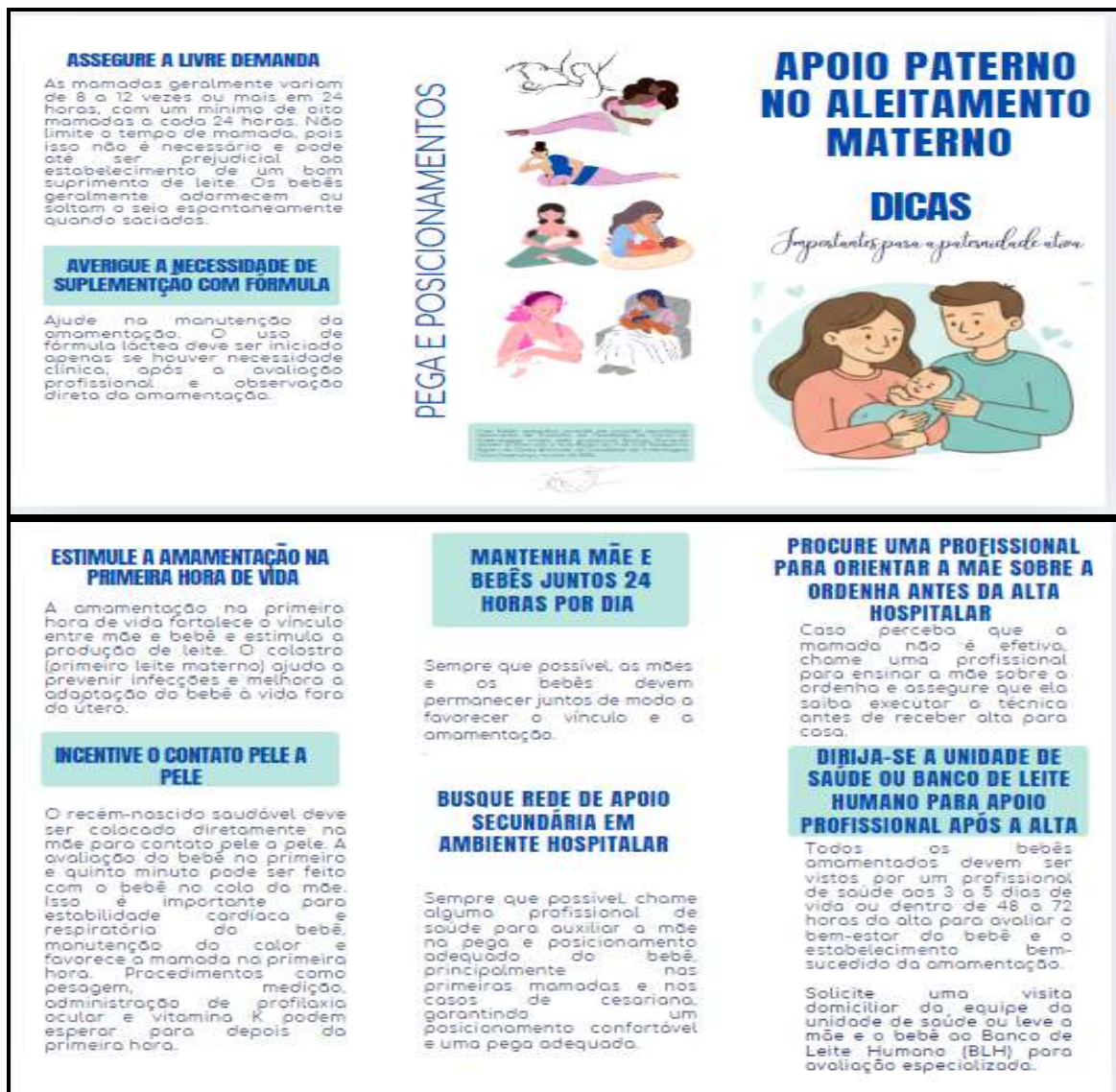
Figura 1- Diagramação do produto tecnológico sobre o apoio paterno no aleitamento materno (frente e verso). João Pessoa, Paraíba, Brasil (2025).

A tecnologia conta com imagens da família unida, com o pai a mãe e o bebê na capa. A imagem simboliza uma representação da figura paterna no cuidado e com presença ativa. Para melhor aproveitamento do espaço do folder , a contracapa existe imagens adicionais de pega e posicionamentos para favorecer a mamada efetiva, bem como uma imagem com linhas de mãos unidas, demonstrando as menções autorais institucionais do produto (Figura 1).